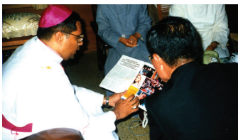
Son Eminence est en train de lire une documentation sur Notre Dame de Naju