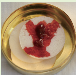
Le Miracle Eucharistique le 16 octobre 2006

Le 8 mai, le Cardinal Ivan Dias fit un rapport en personne au Pape Benoît XVI à propos du miracle Eucharistique qui a eu lieu le 28 février 2010. En plus, il apporta avec lui au Pape l'Eucharistie miraculeuse de Naju qui a saigné le Précieux Sang, le 16 octobre 2006. Le Pape a pris son temps pour voir le miracle Eucharistique de Naju et méditer tranquillement plusieurs minutes avant de donner l'ordre au Secrétaire de Le placer en